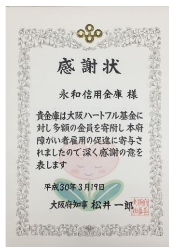
大阪ハートフル基金 への寄付感謝状