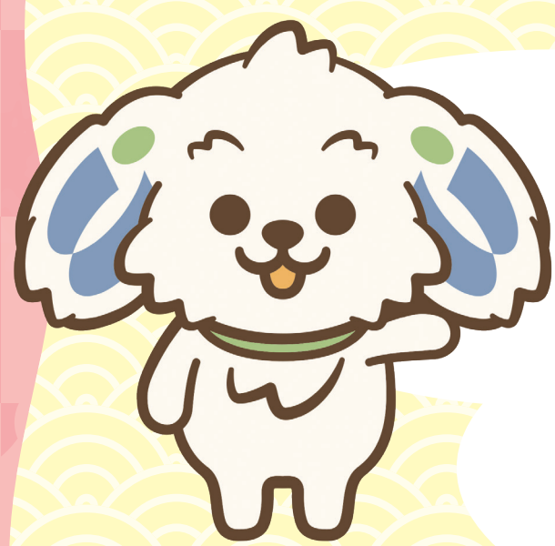
永和信用金庫 公式キャラクター “えいワン”