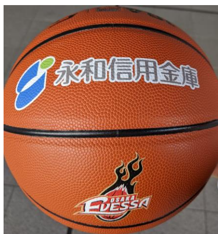
当金庫と大阪エヴェッサのロゴが プリントされたボールを寄贈致しました